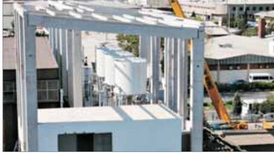
ABB (İsveç) firmasıyla yapılan anlaşma sonrasında SVC (Static Var Compensator) sistemi montajı tamamlanmıştır. Orta gerilim hücreleri montajı da tamamlandıktan sonra soğuk testleri ve performans testleri yapılacaktır.