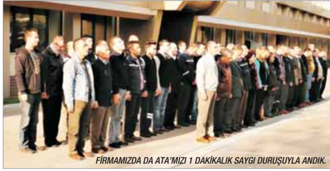
FİRMAMIZDA DA ATA'MIZI 1 DAKİKALIK SAYGI DURUŞUYLA ANDIK.

10 Kasım 1938 günü saat 9'u 5 geçte büyük kurtarıcı hayata veda etti. Rahat uyu Atam...İzindeyiz.