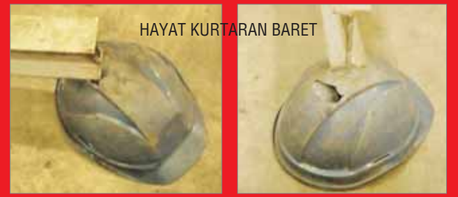
HAYAT KURTARAN BARET

UNUTULMAMASI GEREKEN, KİŞİSEL KORUYUCULARIN TOPLU KORUMA SAĞLAMADIĞI VE TEK KİŞİYİ KORUDUĞUDUR. HER KİŞİSEL KORUYUCU DONANIMIN BİR GÜN ELBET HAYAT KURTARACAĞINI UNUTMADAN DAHA DİKKATLİ VE KAZASIZ ÇALIŞMALAR DİLEĞİYLE.