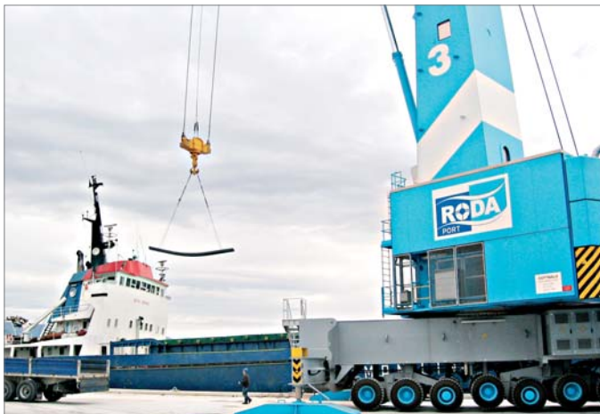
ÇEMTAŞ, ortaklığı bulunduğu RODA Limanının faaliyete geçmesinden sonra, ilk açık yük ihracatını MISIR'a yaptı.

Gümrüksüz alan üzerinde kurulan RODA Limanı, Kuzeybatı Anadolu ve Ankara'ya kadar uzanan bölge içinde faaliyet gösteren sanayi ve ticaret kuruluşlarının ihtiyaçları göz önünde bulundurularak Genel Hizmet Limanı olarak projelendirilmiştir. Liman, gemilerin ihtiyaç duyacakları atık alımı, tatlı su temini gibi hizmetlerini de verecektir. Başta birleştirilmiş yükler olmak üzere her türlü dökme yük, orman ürünleri,